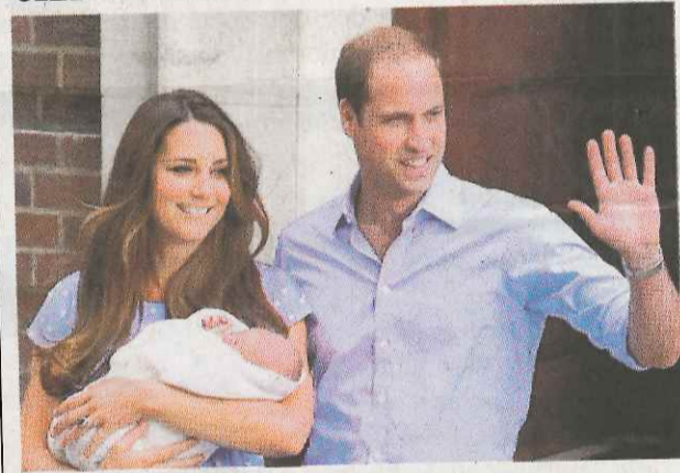
LONDON „Diskretion und Loyalität“ verlangt die Stellenanzeige, und das ist kein Wunder - sollen die Arbeitgeber doch niemand geringeres als Prinz William und seine Frau Kate sein. Mit der diskreten Anzeige im Frauenmagazin „The Lady“ suche das Paar eine Haushälterin, berichtete der „Telegraph“. Putzen, Kleiderpflege, Silber und Glas polieren, einkaufen, manchmal kochen oder mit dem Hund raus gehen: Die Aufgaben sind vielfältig. Auch Kinderbetreuung gehört dazu, schließlich bekommt Prinzchen George in ein paar Wochen ein Geschwisterchen.