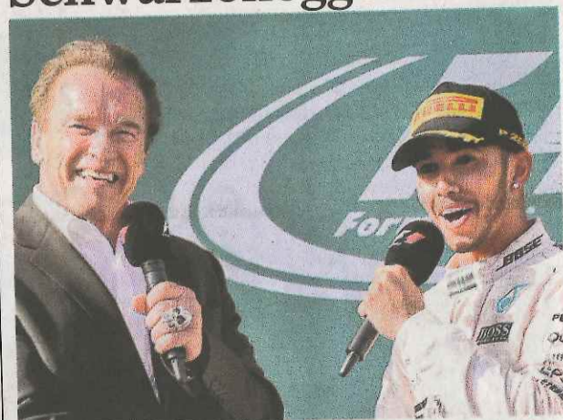
MELBOURNE Nicht einmal der „Terminator“ war vor der überschäumenden Freude von Sieger Lewis Hamilton beim Großen Preis von Australien sicher. Nach der weltmeisterlichen Fahrt zum Auftakterfolg über seine deutschen Verfolger Nico Rosberg und Sebastian Vettel sagte der Formel-1-Herrscher frech grinsend auf dem Podium zu Interviewpartner Arnold Schwarzenegger: „Ich dachte, du wärst größer“.