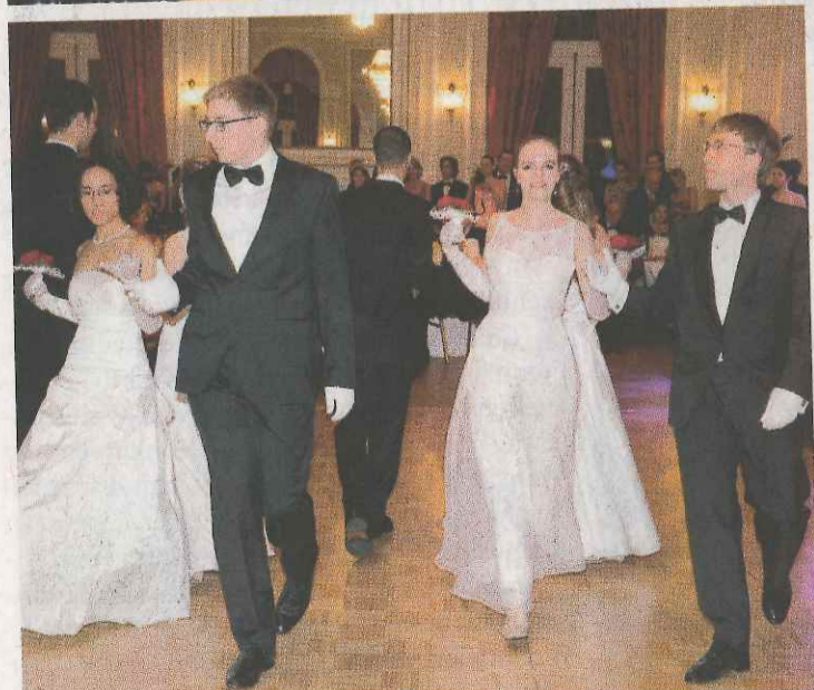
LUXEMBURG Der Wiener Ball mausert sich ähnlich wie der Opernball in Wien zu einem herausragenden gesellschaftlichen Ereignis der Saison. Die Beliebtheit dieses Balls ist auf die enge Verbundenheit und das hervorragende Verhältnis zwischen dem Großherzogtum